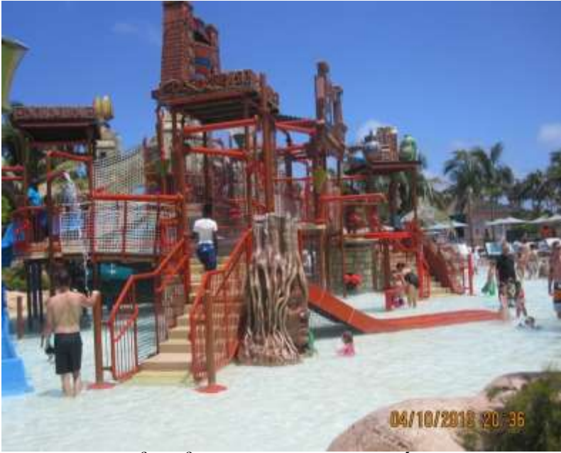
Địa điểm để phao cho người lớn đến mượn