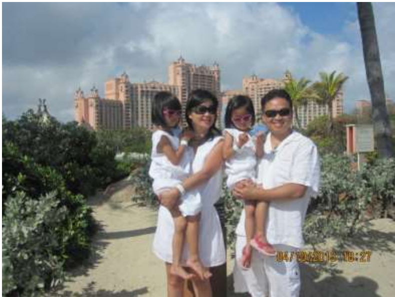
The Reef Atlantis