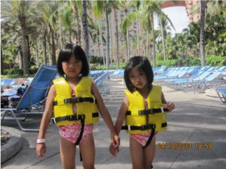
Các cháu nhỏ mang phao đang đi đến hồ bơi