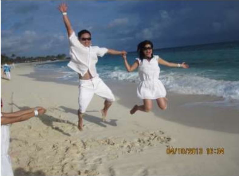
Du khách chụp hình và vui đùa trên bãi biển