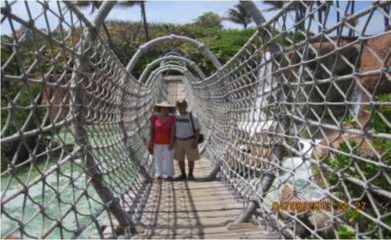
Du khách chụp hình làm kỷ niệm