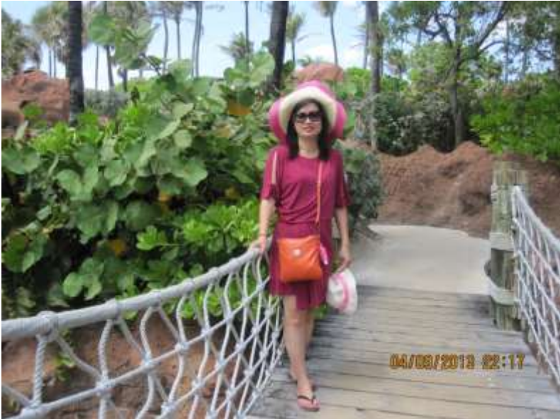
Du khách chụp hình làm kỷ niệm