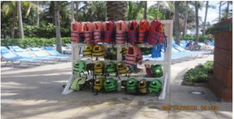
Giá để phao của các trẻ nhỏ